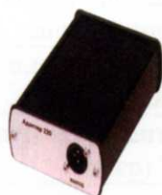
Адаптер для подключения к сети 220 В

Схема пломбировки от несанкционированного доступа (а) и обозначение места для размещения наклейки (б) и знака поверки (в) приведены на рисунке 3.